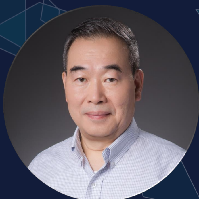
蒲慕明 Mu-ming Poo Chinese Academy of Sciences